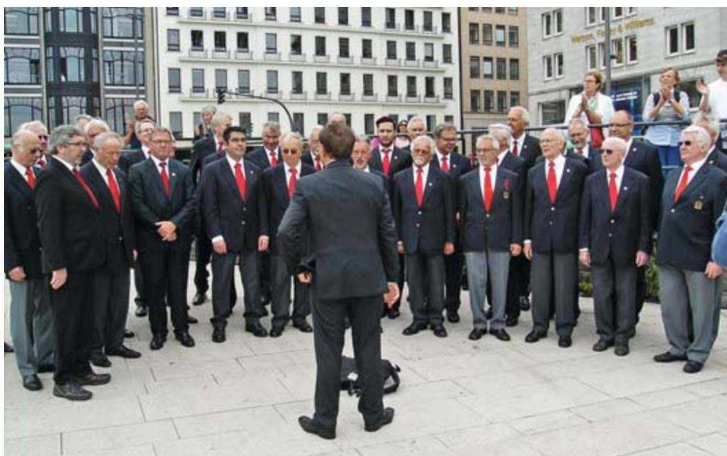
Die »Hamburger Liedertafel von 1823« 2016 vor dem Streit's Haus am Jungfernstieg