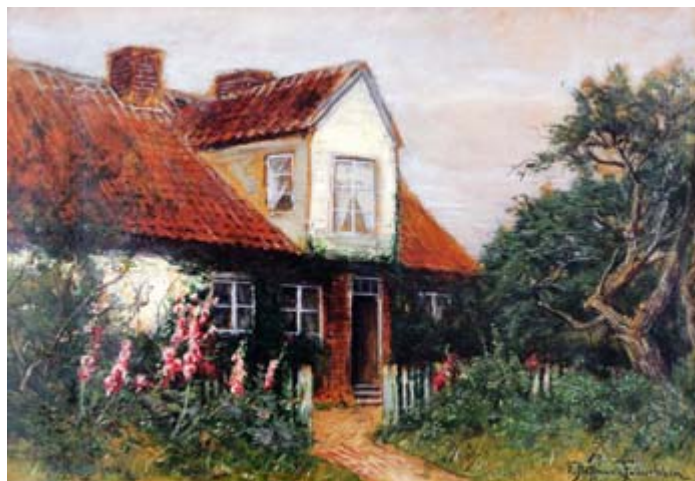
Haus Cassebohm, hier wurde die Hymne niedergeschrieben

Das »Lied der Deutschen« hingegen ist kein Kriegslied. Anfang des 19. Jahrhunderts gab es keinen einheitlichen deutschen Staat. Deutschland zerfiel nach dem Wiener Kongress 1815 in 41 souveräne Königreiche, Fürstentümer und Freie Reichsstädte, ohne einheitliches politisches System, Währung oder gar einen gemeinsamen Staatsoberhaupt.