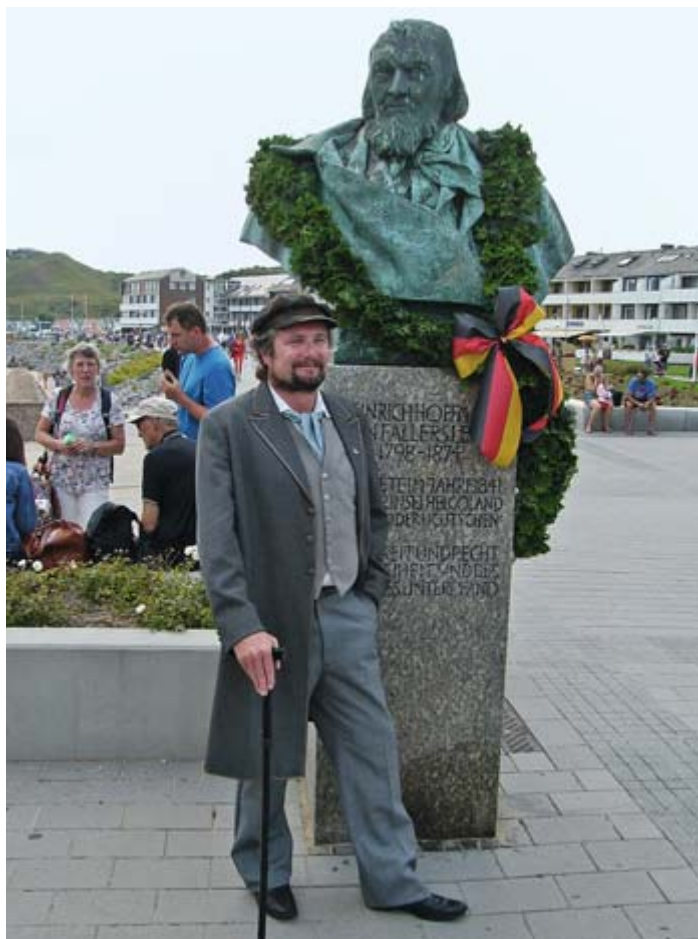
Das Hoffmann-Denkmal mit dem Helgoländer Hoffmann-Darsteller

Mir schien Helgoland wie ausgestorben, ich fühlte mich sehr verwaist. Aber ich freute mich auch, dass ich nach den unruhigen Tagen wieder einmal mir selbst gehören durfte. Wenn ich dann so einsam auf der Klippe wandelte, nichts als Himmel und Meer um mich sah, da wurde mir so eigen zu Mute, ich musste dichten, und wenn ich es auch nicht gewollt hätte«.